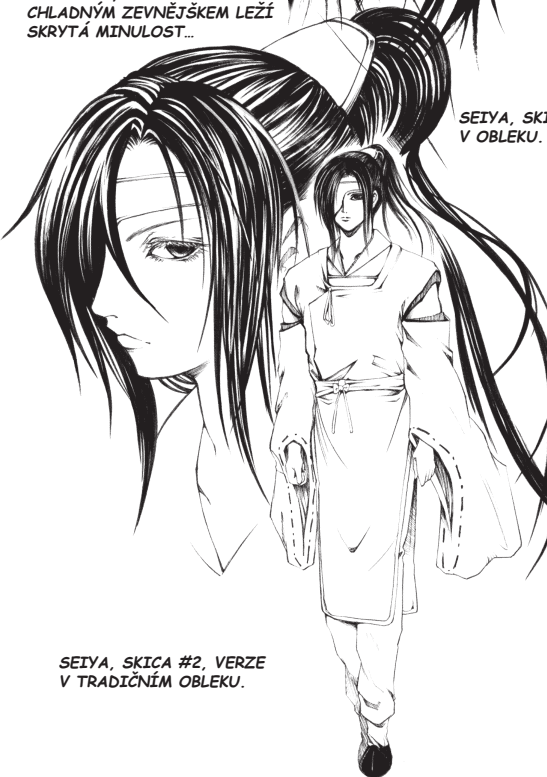
SEIYA, SKICA #2, VERZE V TRADIČNÍM OBLEKU.