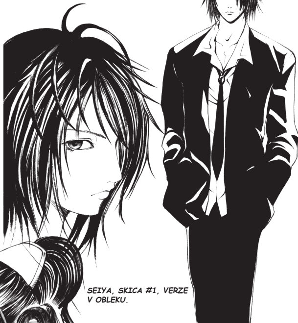
SEIYA, SKICA #1, VERZE V OBLEKU.