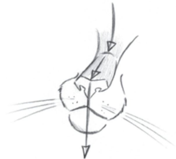
Podívejte se, jak vám středová čára pomůže udržet přesný úhel čenichu.