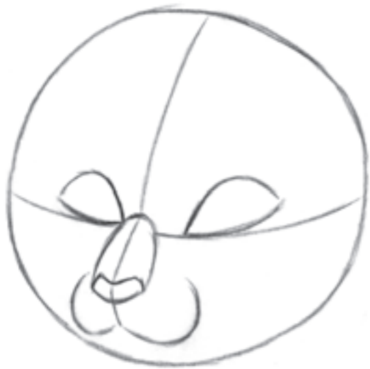
Začněte jednoduchým kruhem, který naznačí hlavu.

Pohled z poloprofilu ukazuje, proč je tak užitečná středová svislá čára. Nakreslení středové čáry shora dolů dodá kresbě dojem hloubky, neboť pokračuje přes nosní hřbet, kde se čára prodlužuje za hranice lebky.