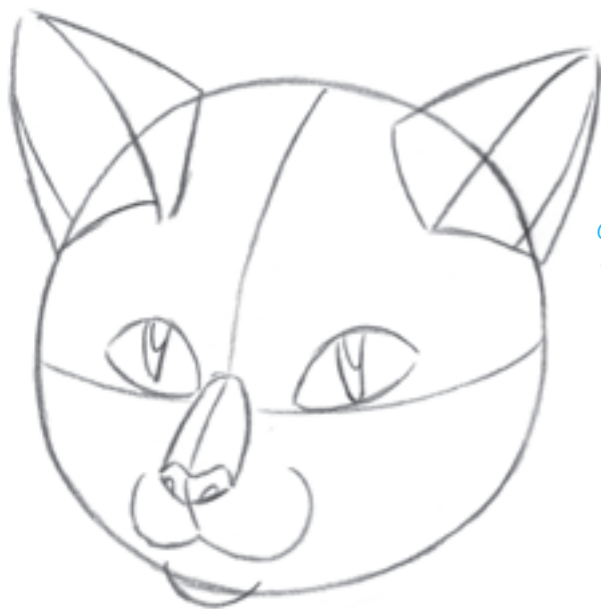
Přidejte drobnou bradičku, tak aby nepatrně zasahovala do kontur hlavy.