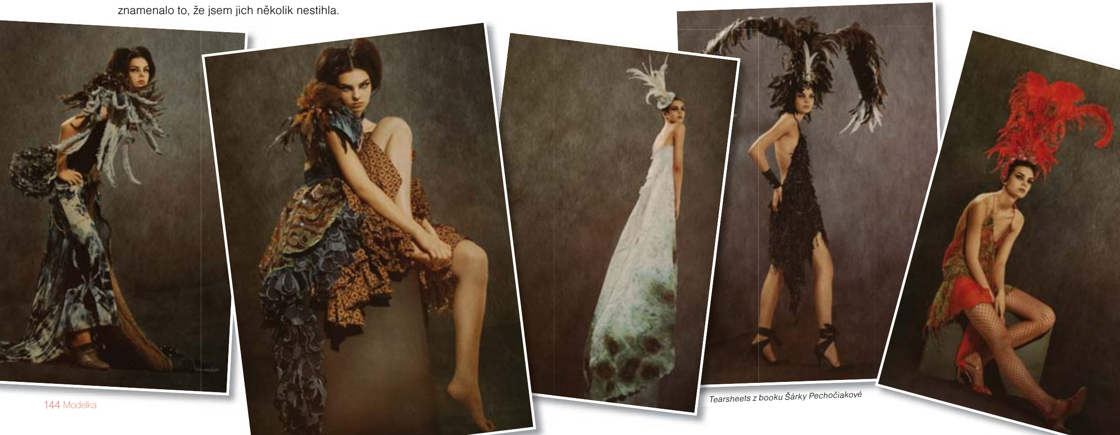
Tearsheets z booku Šárky Pechočiakové