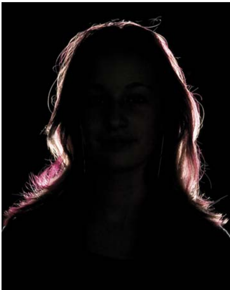
8.25 Samotné obrysové světlo vytvoří „svatozář“, linie světla okolo hlavy.

má pro různé lidi různé významy. Ale jistě se všichni shodneme minimálně na tom, že fotografie s tlumeným svícením a temnějším podáním v nás vyvolá jiné pocity než ta se zářivým světlem.