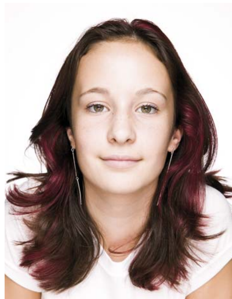
8.29 Převaha světlých tónů dává obrázku v high-key stylu zřetelně mladistvý, veselý a otevřený vzhled.

Na obrázku 8.28 je znázorněno, jak byla postavena světla pro uvedenou fotografii high-key portrétu.