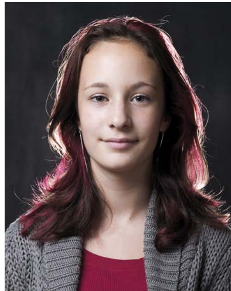
8.26 Obrysové světlo spolu s hlavním a doplňkovým světlem. Všimněte si, jak obrysové světlo oddělilo hlavu modelky od pozadí.

Aby fotografové zabránili zmatení pojmů u lidí s různými představami a názory, nemluví o náladě fotografie, ale o jejím tónu. Ani tóny však nejsou přesně definovány žádnými proměnnými. Světlo a způsob svícení může být nejdůležitější proměnnou, ale podstatné rysy modelu nebo stanovení expozičních hodnot mají také výrazný vliv na tón fotografie.