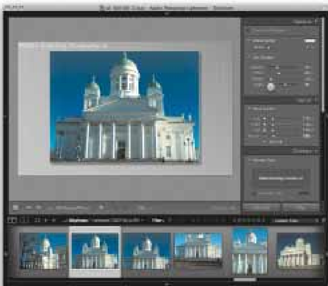
Obrázek 11.2 V okně obsahu se zobrazuje aktuálně vybraný snímek podle nastavení prezentace.

V okně obsahu se zobrazuje náhled prezentace s právě vybraným snímkem. Obrázek můžete změnit pomocí kurzorových šipek nebo odpovídajícími tlačítky v panelu nástrojů ( obrázek 11.2 ) a samozřejmě pomocí filmového pásu. Pokud dojde k nějakým změnám nastavení prezentace v pravém panelu, změny se zobrazí v náhledu. Prvky jako vodítka, vložené texty apod. v náhledu jsou aktivní a jejich přetažením se mění i nastavení odpovídajících ovládacích prvků v pravém panelu. Jako v každém modulu, můžete panel nástrojů skrýt či zobrazit pomocí klávesy T.