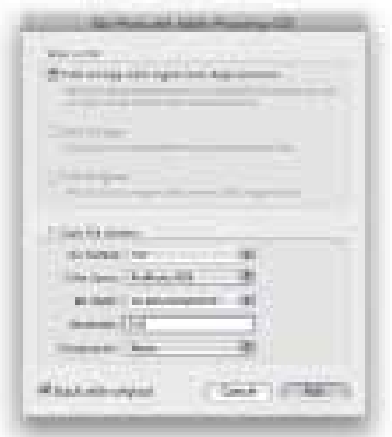
Obrázek 9.4 Toto okno se zobrazí, pokud budete upravovat raw obrázek a stisknete Ctrl+E, spustíte tedy funkci Edit in Photoshop. Jediná možnost, kterou máte k dispozici je upravit překreslenou verzi fotky s úpravami z Lightroomu. Možnost „Stack with original“ automaticky uloží novou verzi k původnímu obrázku.