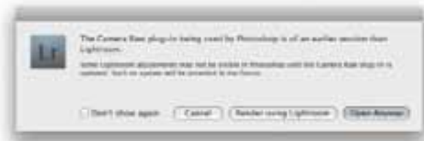
Obrázek 9.2 Pokud nemáte nejnovější verzi Camera Raw pro Photoshop CS3 anebo používáte starší verzi Photoshopu, uvidíte tento dialog, když budete chtít ve Photoshopu upravovat raw snímek.

nejnovější verze Photoshopu, kterou na počítači máte. Volby pod tímto názvem vám umožní nastavit základní formát souboru, RGB prostor a barevnou hloubku. Toto nastavení se použije, kdykoli stisknete kombinaci Ctrl+E, pro úpravu originálního obrázku ve Photoshopu. Pokud bude fotka, kterou takto otevřete ve formátu raw a vy budete mít nejnovější verzi Camera Raw (tedy 4.4.1 nebo novější) pro Photoshop CS3 (nebo novější), pak se obrázek otevře přímo ve Photoshopu. Pokud nemáte nejnovější verzi, pak se objeví upozornění jako na obrázku 9.2 . Zde dostanete na výběr „Open Anyway“ (přesto otevřít – možná, že i starší verze Camera Raw přečte vaše nastavení) anebo „Render using Lightroom“ (vykreslit pomocí Lightroomu). Lightroom pak vytvoří kopii zdrojového obrázku a přidá ji do katalogu.