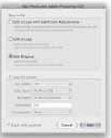
Obrázek 9.6 Pokud v Lightroomu zvolíte obrázek v jiném formátu než raw a použijete funkci Edit in Adobe Photoshop (Ctrl+Alt+E), budete mít k dispozici všechny možnosti nastavení editace. Můžete vytvořit kopii originálního obrázku s úpravami z Lightroomu, upravovat kopii bez aplikovaných úprav anebo upravovat přímo originál taktéž s aplikovanými úpravami.