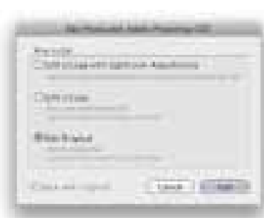
Obrázek 9.3 Pokud otevřete fotku v jiném formátu než v rawu pomocí příkazu Edit in Photoshop, budete moci zvolit Edit Original (čímž fotografii otevřete, aniž byste ji vložili do katalogu) anebo některou možnost úpravy kopie, Edit Copy, zobrazené tady na obrázku.

Jestliže jste se rozhodli takto otevřít snímek, který není raw, zobrazí se vám okno jako na obrázku 9.3 , ve kterém máte možnost Edit Original – otevřete přímo zdrojový obrázek. Nebo můžete upravovat kopii originálu, Edit Copy s anebo bez úprav provedených v Lightroomu. Lightroom otevře kopii zdroje a automaticky ji přidá do katalogu jako kopii. Lightroom vám standardně nabízí možnost Edit Original, a to protože velmi často budete chtít otevřít ve Photoshopu obrázek přímo, aniž byste vytvářeli kopii. Tato funkce se tedy hodí, pokud chcete otevřít snímek, který obsahuje vrstvy anebo se jedná o už vytvořenou kopii původní fotky. Chcete-li vytvořit kopii originálu, a až tu pak dále upravovat, zvolte možnost Edit a Copy (ignorujete ale veškeré úpravy provedené v Lightroomu). Dále můžete zvolit Edit Copy with Lightroom Adjustments, čímž otevřete JPEG, TIFF nebo PSD soubor se všemi úpravami použitými v Lightroomu. Pokud tedy používáte vlastnosti z Lightroom Develop k úpravě JPEG, TIFF nebo PSD obrázků a chcete upravovat kopie těchto obrázků, pak je toto vaše volba.