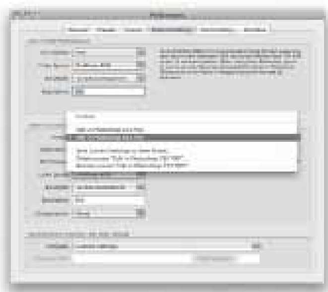
Obrázek 9.1 Nastavení pro úpravu v externím programu si můžete upravit v nabídce Edit > Preferences. Zvolte Additional External Editor a nastavte File format (formát souboru), Color Space (barevný prostor) a Bit Depth (barevná hloubka). Toto nastavení pak budete používat při úpravách originálního obrázku ve Photoshopu nebo jiném programu.

Nejprve se podívejte se do předvoleb (Edit > Preferences) a zvolte External Editing ( obrázek 9.1 ). Existují dva způsoby, jak upravit obrázek z katalogu mimo Lightroom. Základní funkce Edit (Ctrl+E) vykreslí originální snímek jako pixelový obrázek, aniž by přidala do katalogu jeho kopii nebo cokoli jiného. Udělá tak jedním ze dvou způsobů. V horní části okna External Editing je zobrazen externí program, ve kterém úprava proběhne. Bude to