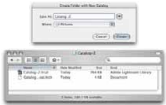
Obrázek 5.2 Když budete vytvářet nový katalog, budete požádáni o vytvoření nové složky a pojmenování katalogu.

Chcete-li vytvořit nový katalog, zvolte File > New Catalog (Soubor > Nový katalog). Otevře se dialogové okno na obrázku 5.2 . Musíte určit, kam se katalog má uložit, a pojmenovat jej. Vznikne nová složka s katalogem. Kromě souboru .lrcat bude ve složce také soubor .lock, když s katalogem zrovna budete pracovat.. Tento dočasný soubor brání ostatním uživatelům Lightroomu v přístupu k témuž katalogu přes počítačovou síť.