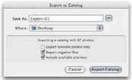
Obrázek 5.4 Dialogové okno Export as Catalog se objeví, když budete chtít snímky exportovat jako katalog. Můžete exportovat pouze vybrané fotografie, nebo všechny fotografie zobrazené v modulu Library a na filmovém pásu.

Při zapnuté volbě Export negative files, se exportuje kopie stávajícího katalogu obsahující všechny zdrojové snímky, tzn. raw, JPEG, TIFF a PSD soubory. Jinými slovy, Lightroom exportuje všechny informace v katalogu spolu s originálními zdrojovými soubory.